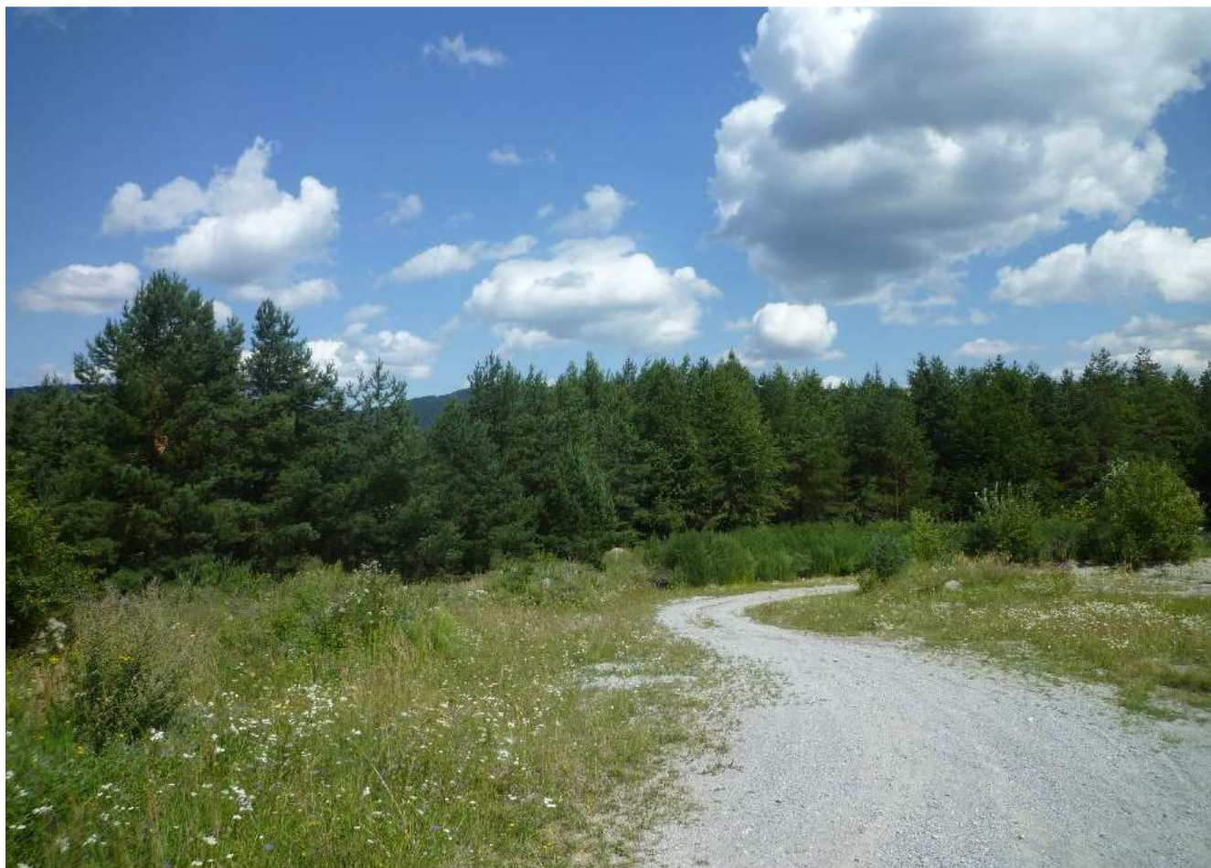
Obr.č.13: Sekundárne borovicové porasty, ktoré križuje trasa vedenia v navrhovanom variante VP2 pri Veľkom Poli v blízkosti cintorína a ťažobného priestoru.