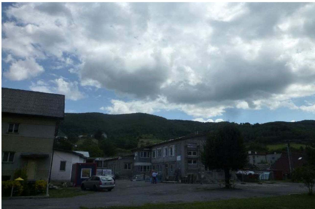
Obr.č.24: Lesné porasty nad Hradičovom (v pozadí), cez ktoré je trasovaný variant HR2.