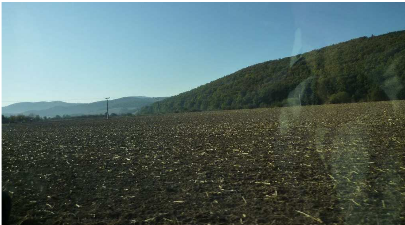
Obr.č.1: Poľnohospodárska pôda v k.ú Veľké Uherce - miesto napojenia navrhovaného vedenia 2x400kV na prvú etapu (Vedenie 2x400 kV lokalita Bystričany - Križovany). Oslianska kotlina je z východu ohraničená Trábečským predhorím, ktorého okrajom vedie trasa navrhovaného vedenia vo variante HV1.