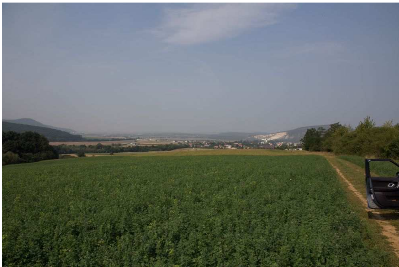
Obr.č.7: Pohľad na Osliansku a Hornonitriansku kotlinu - koridor trasy navrhovaného vedenia vo variante HV2 vedúci po poľnohospodárskej pôde na území Oslian, Hornej Vsi až po osadu Rudica.