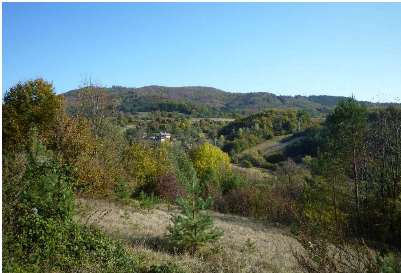
Obr.č.15: Pohľad na typickú mozaikovitú štruktúru krajiny v okolí Veľkého Poľa - Škriniarov štál, Matiašov štál, Horní Jakalovci v blízkosti variantov VP1, VP2 aj VP3.