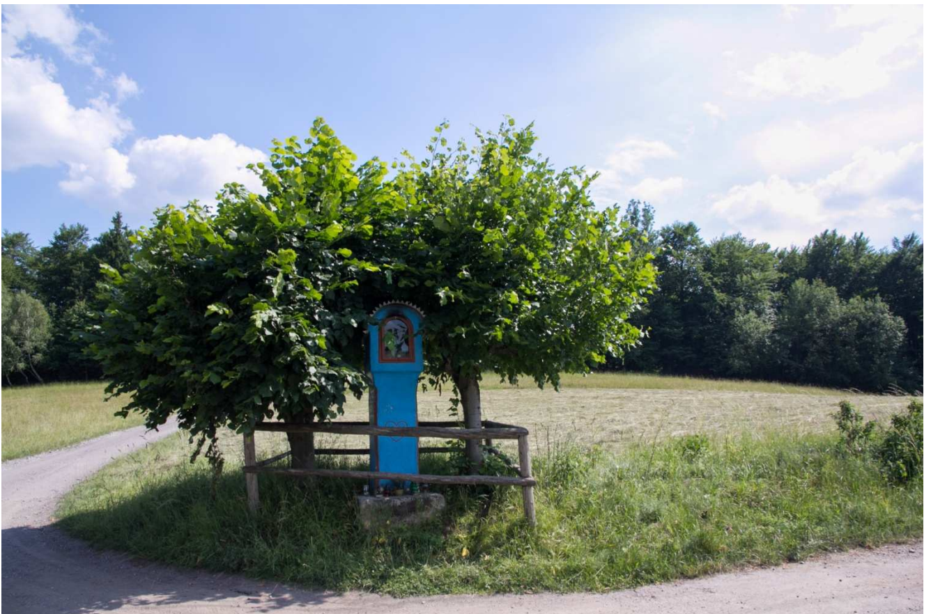
Obr.č.21: Krajinársky hodnotná lokalita medzi usadlosťami Horní Zajacovci a Kristiánovci v blízkosti trasy HR1.