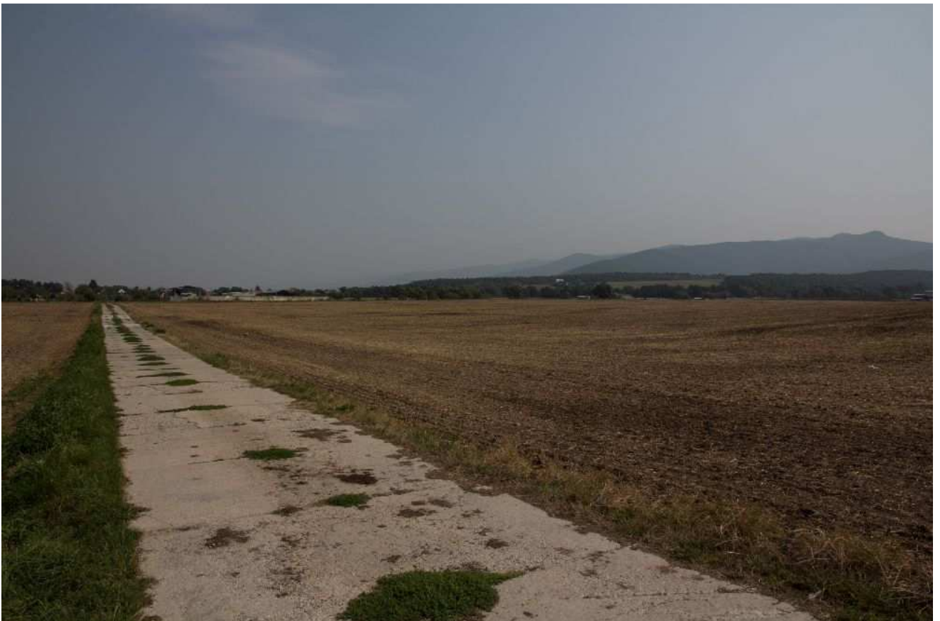
Obr.č.6: Začiatok trasy navrhovaného vedenia cez k.ú. Oslany v úseku variantu HV2 cez ornú pôdu.