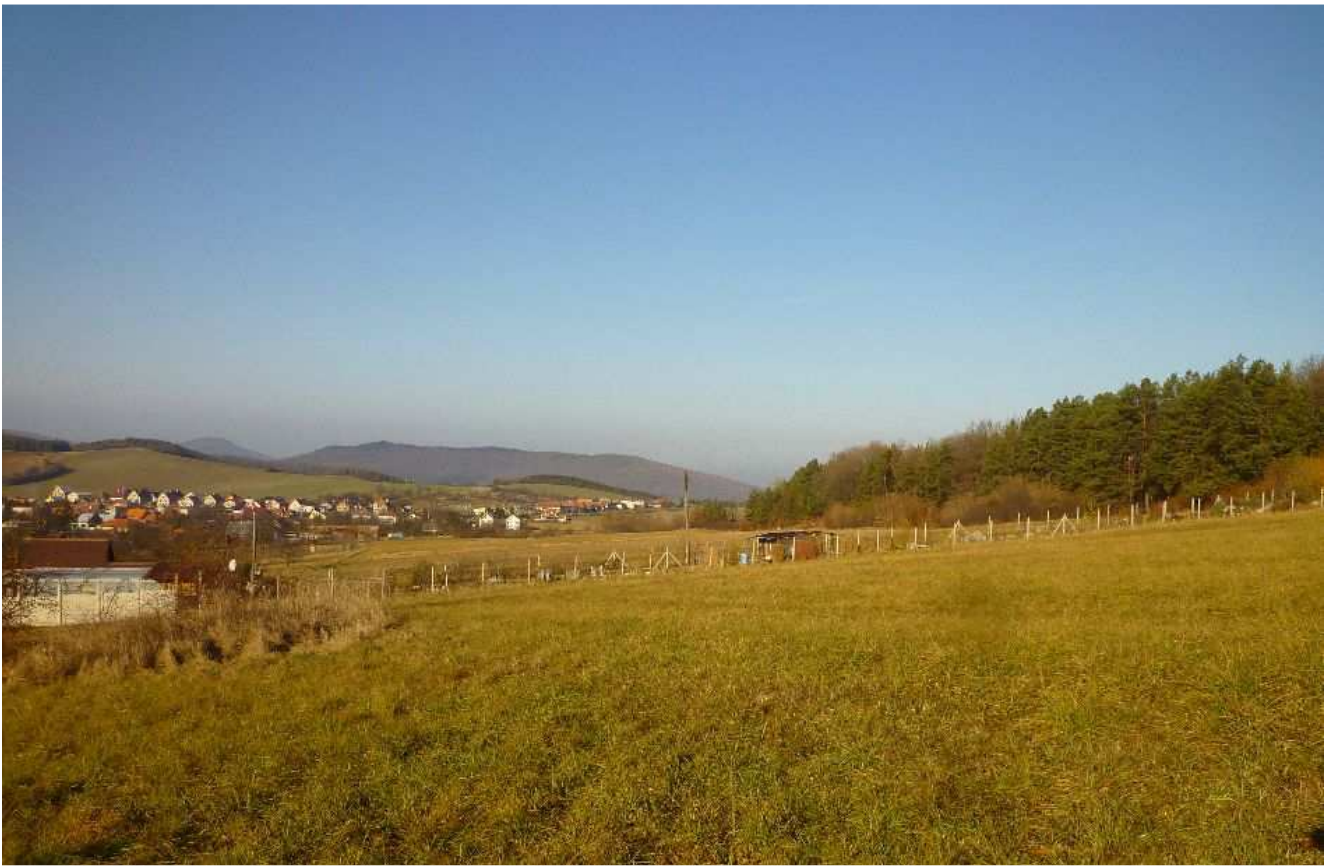
Obr.č.3: Rozširujúci sa intravilán Radobice a konfliktný dom (na snímke vľavo) so zázemím v ochrannom pásme trasy vedenia v navrhovanom variante HV1.