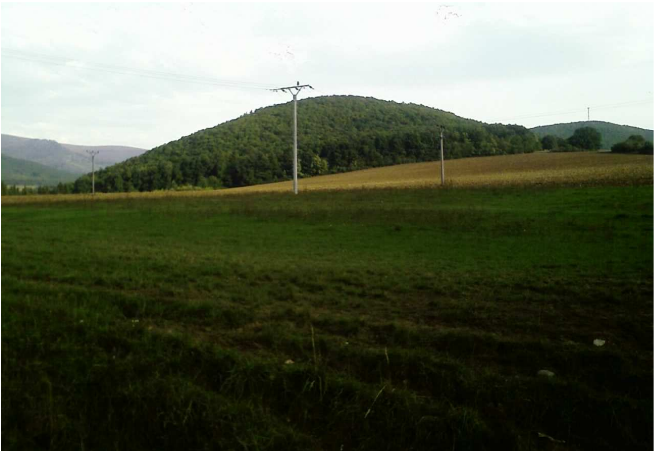
Obr.č.5: Trasa vedenia v krátkom samostatnom úseku variantu HV3 od poľnohospodárskeho družstva v Hornej Vsi cez lesné porasty vo svahu Chlmok až k osade Rudica.