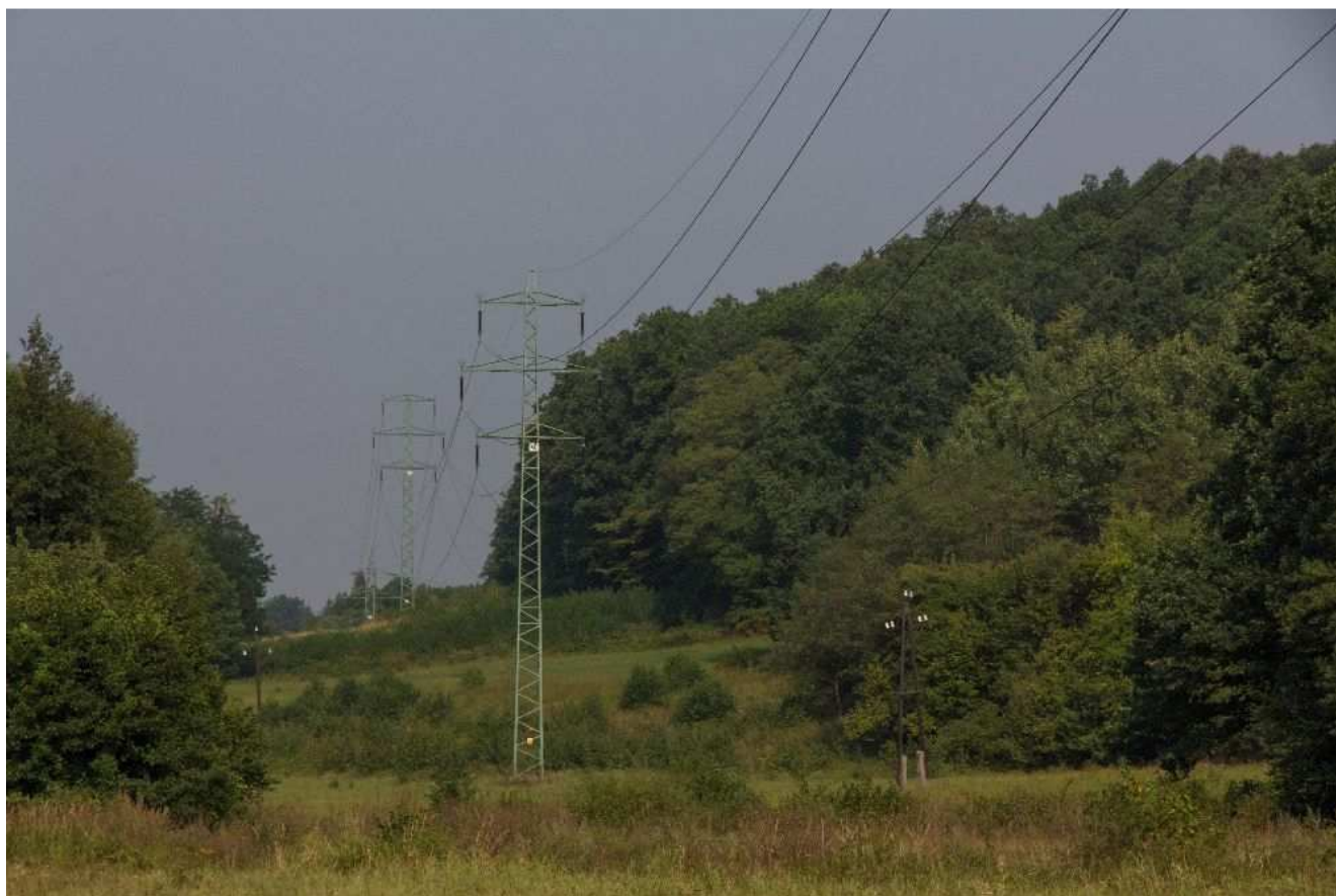
Obr.č.9: Koridor existujúceho vedenia 2x110 kV V7747/V7747 v Radobickej doline, v súbehu s ktorým vedie trasa navrhovaného vedenia od osady Rudica vo variantoch HV2 a HV3, pohľad severozápadným smerom.