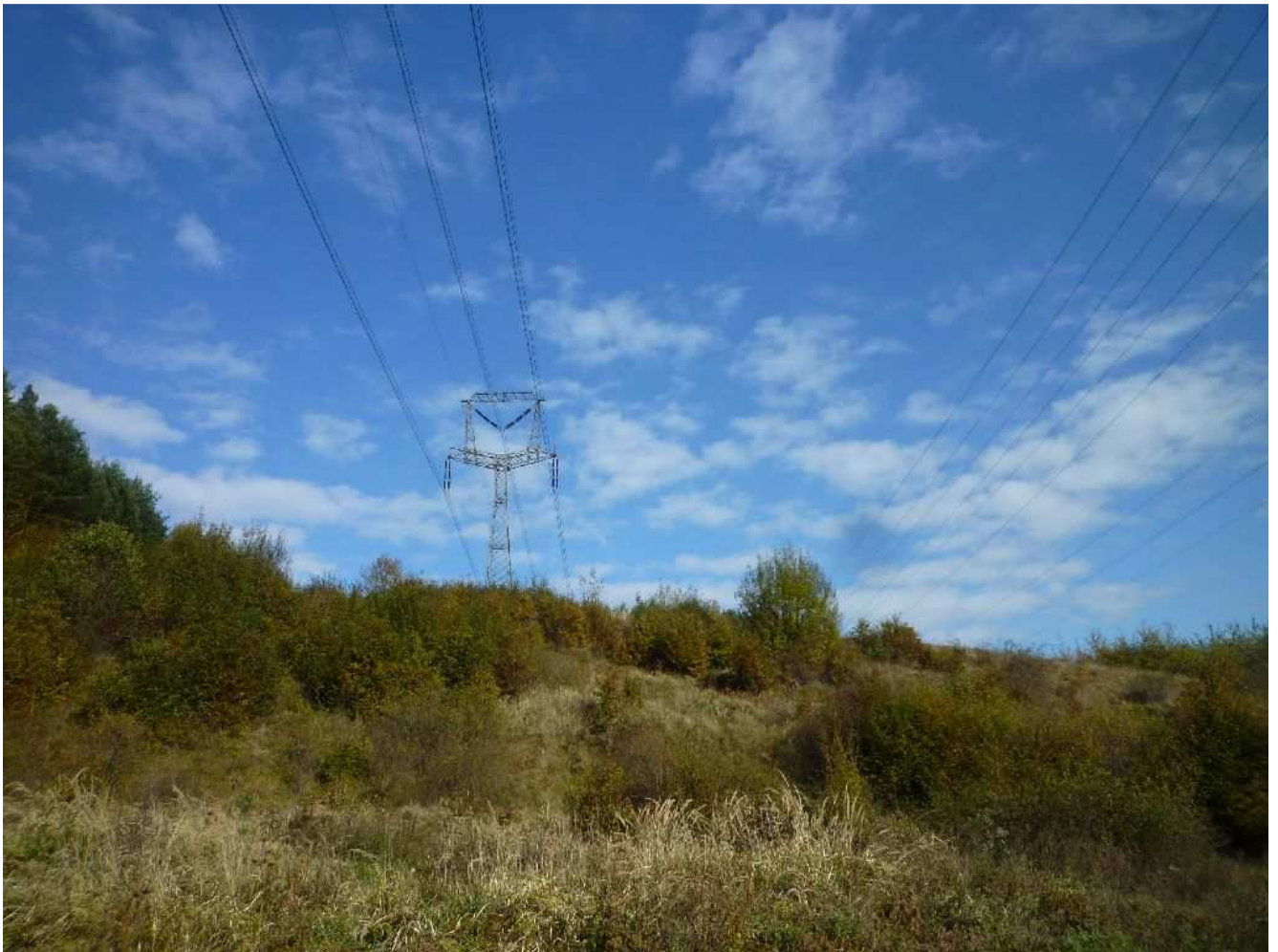
Obr.č.25: Križovanie Záhradnej doliny pri Bukovine vedeniami 2x110 kV V7747/V7747, 2x110 kV V7507/V7508 a 400 kV V492, úsek variantu 1-v.