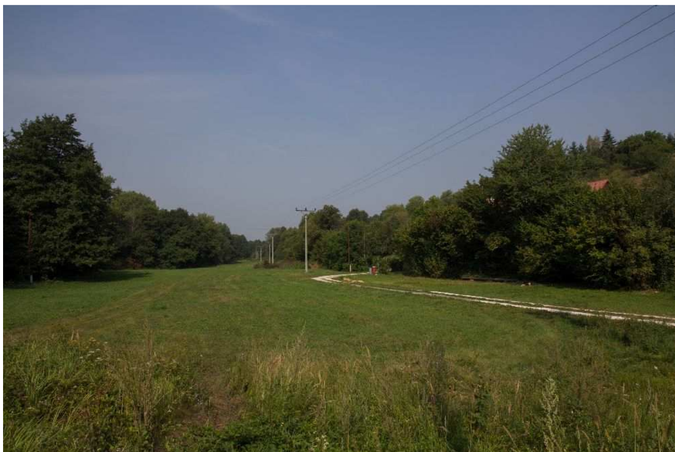
Obr.č.8: Koridor trasy navrhovaného vedenia vo variante HV2 – niva Oslianskeho potoka, pod osadou Rudica.