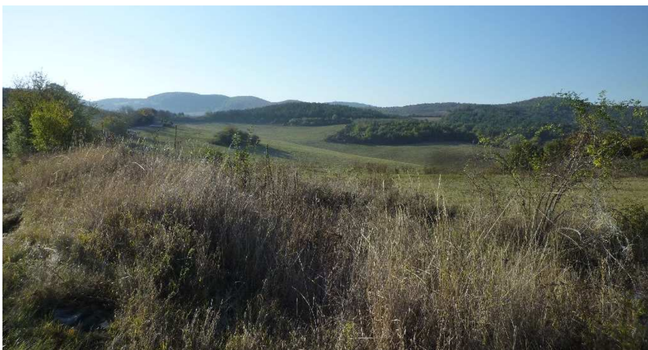
Obr.č.2: Už zvlnená krajina s častejším striedaním krajinných štruktúr a členitejším reliéfom v okolí Hornej Vsi s trasovaním navrhovaného vedenia vo variante HV1.