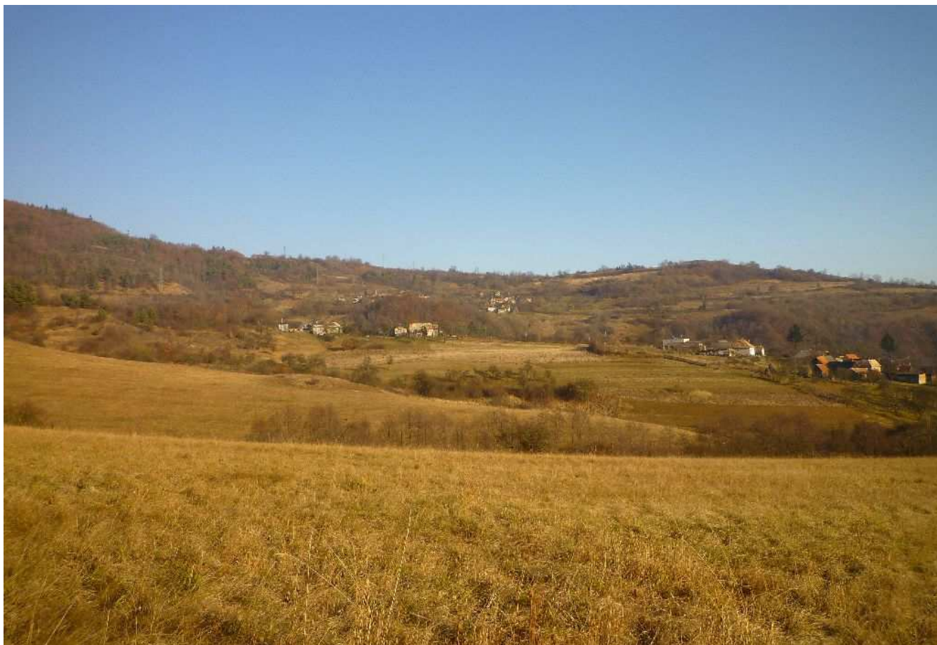
Obr.č.18: Rozptýlené osídlenie Horný Župkov – Frtálov vrch, severne od ktorého vedie navrhované vedenie vo variante 1-z.