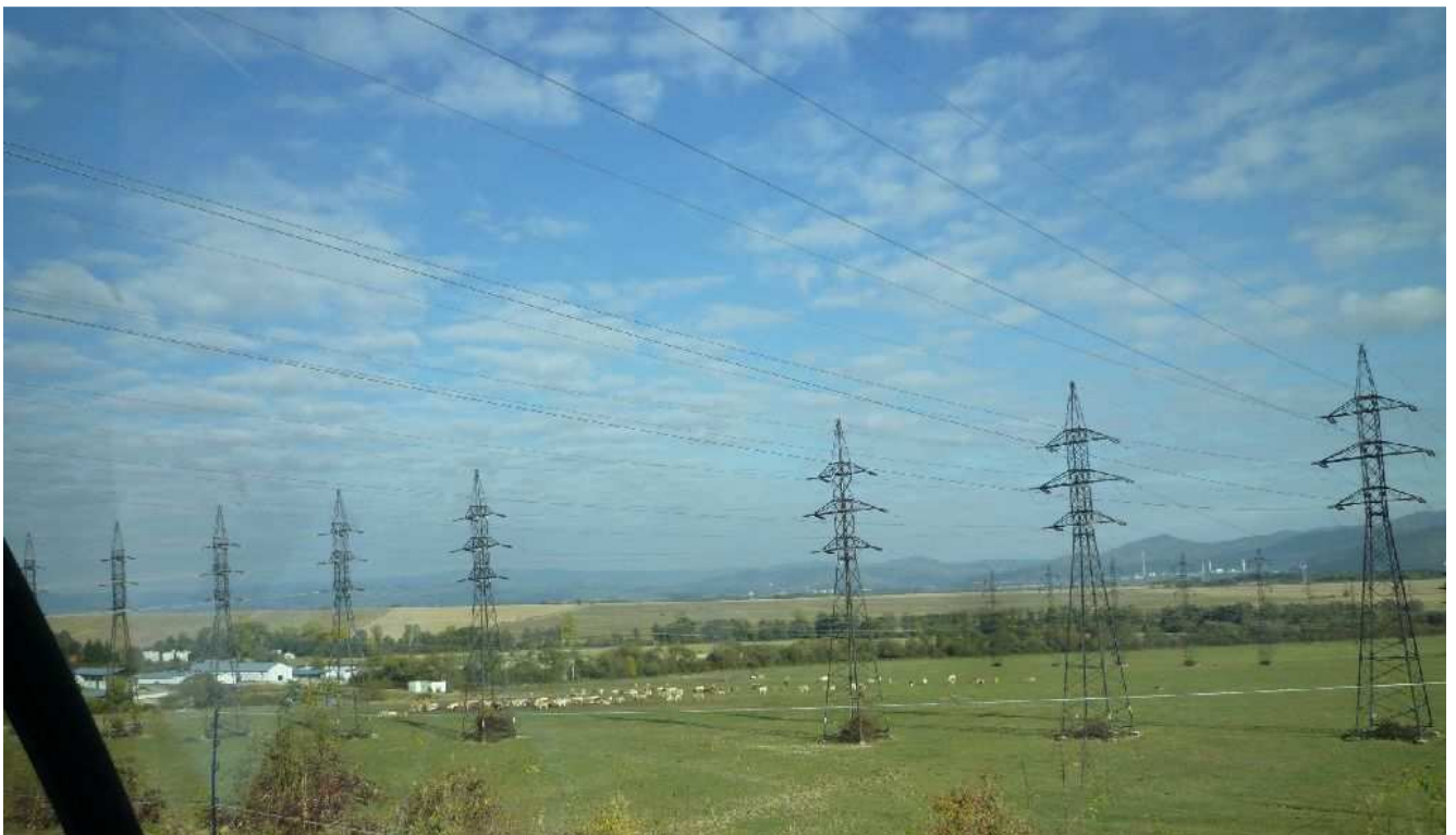
Obr.č.26: Okraj Žiarskej kotliny pri zaústení do TR Horná Žďaňa, úsek variantu 1-v.