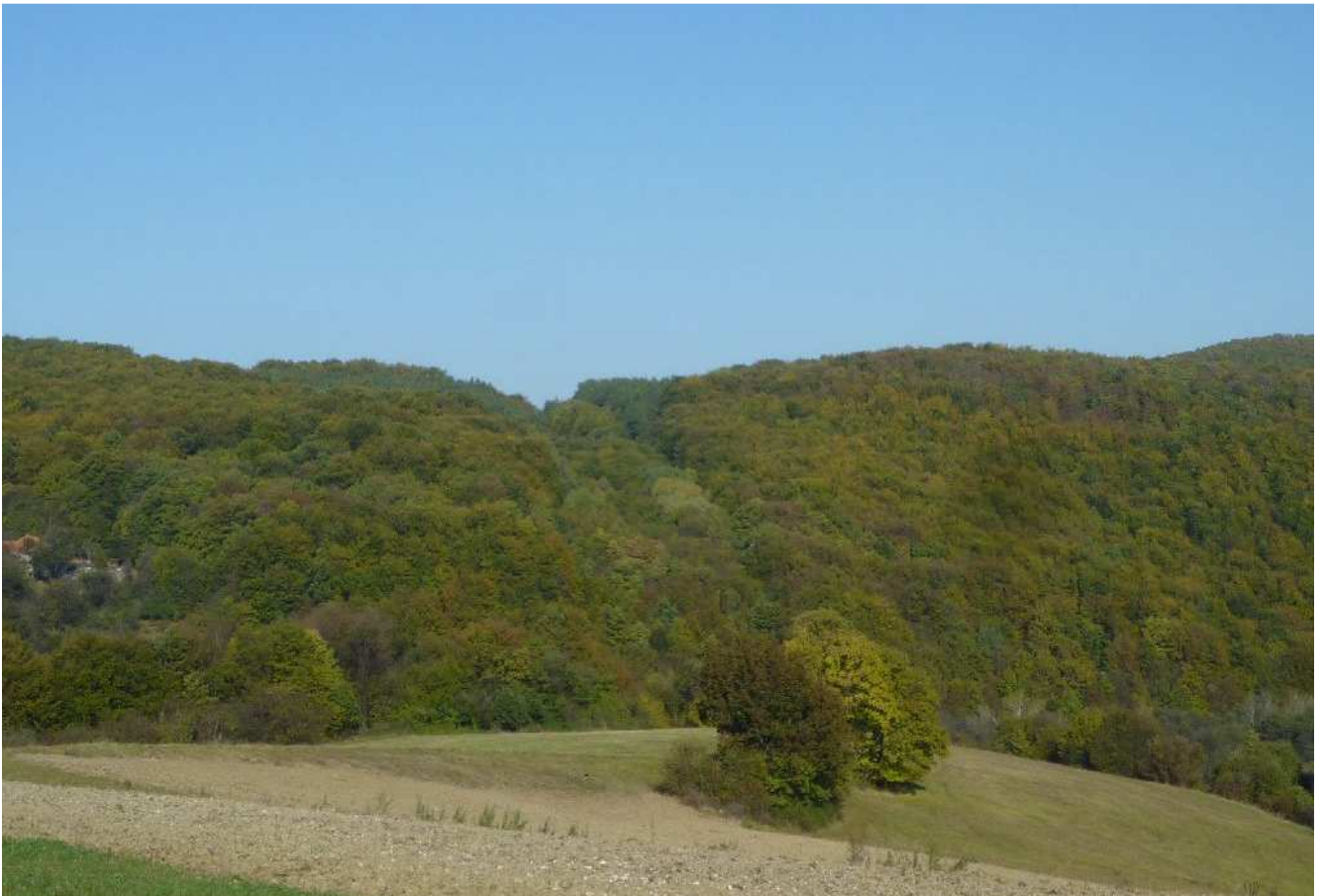
Obr.č.4: Pohľad západným smerom k Radobici od osady Cerová – viditeľný bývalý priesek demontovaného vedenia 220 kV lesným porastom, v koridore ktorého vedie variant HV1.