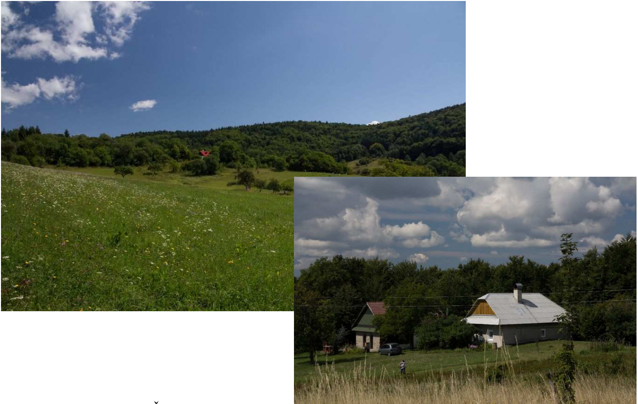
Obr.č.19,20: Osídlenie Čierťáže – rekreačne využívané ale ešte stále aj trvalo obývané, z dôvodu ochrany ktorého bol tiež navrhnutý variant HR2 vedúci lesnými porastmi nad Hradičvom