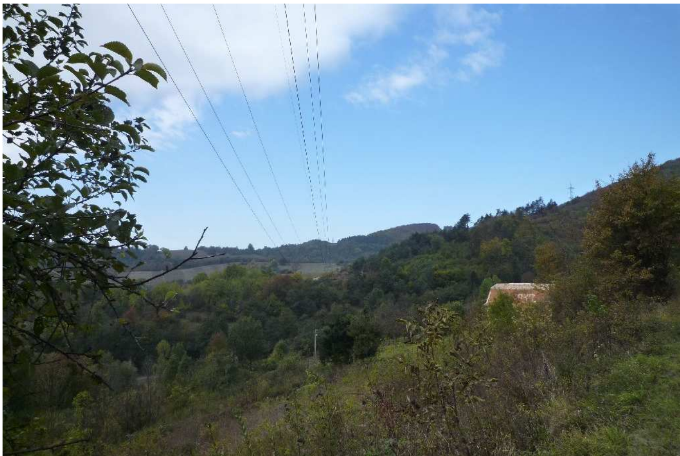
Obr.č.17: Existujúca sieť vedení 2x110 kV na trase variantu 1z v blízkosti usadlosti Števuovci.