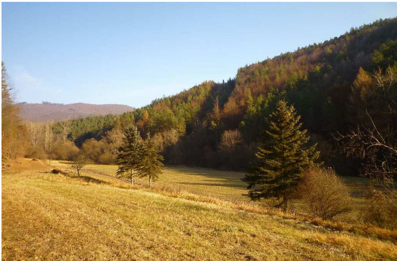
Obr.č.11: Pohľad od cesty II/512 pri Veľkom Poli (styčný bod VP1 a VP2) východným smerom – viditeľný bývalý priesek demontovaného vedenia 110 kV, v koridore ktorého vedie trasa 2x400 kV vedenia ďalej v spoločnom úseku variantov VP1 a VP2.