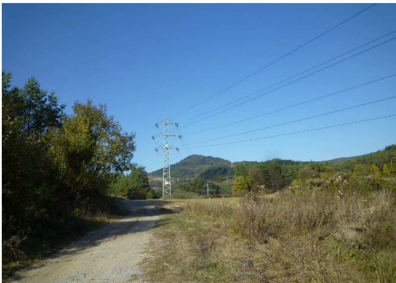
Obr.č.16: Existujúca sieť vedení 2x110 kV na trase variantu VP3. V pozadí domy rozptýleného osídlenia.