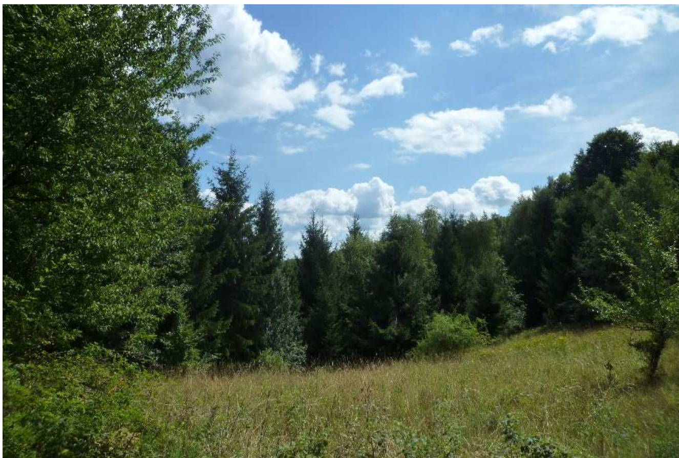
Obr.č.23: Zmiešané lesné porasty, cez ktoré vedie trasa 2x400kV vedenia v navrhovanom variante HR2.