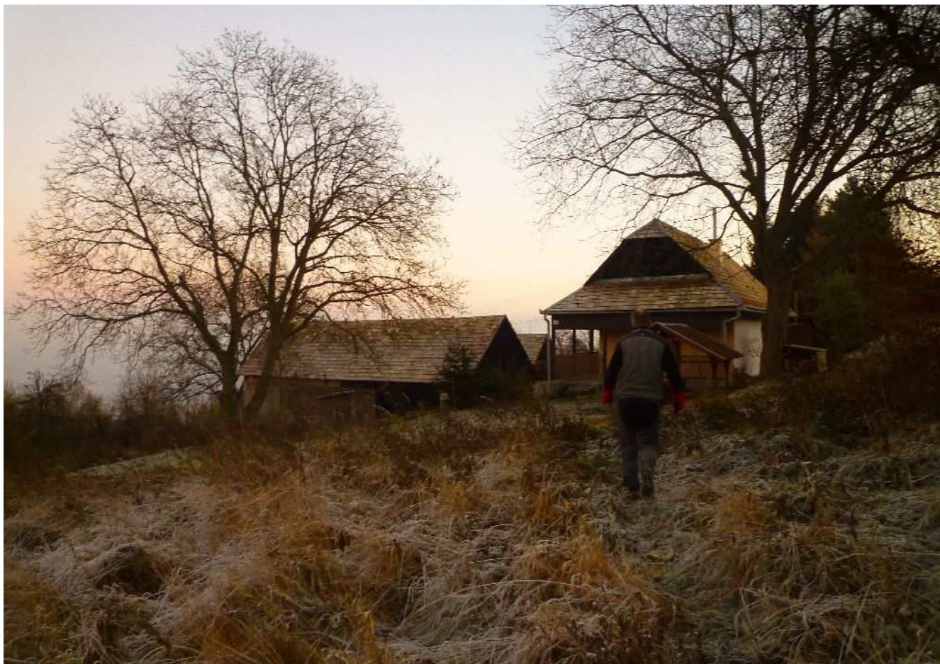
Obr.č.22: Rekreačne využívaná usadlosť Kristiánovci v blízkosti variantov HR1 a HR2, v oboch prípadoch by bola línia vedenia vizuálne „skrytá“ za lesné porasty a porasty NDV.