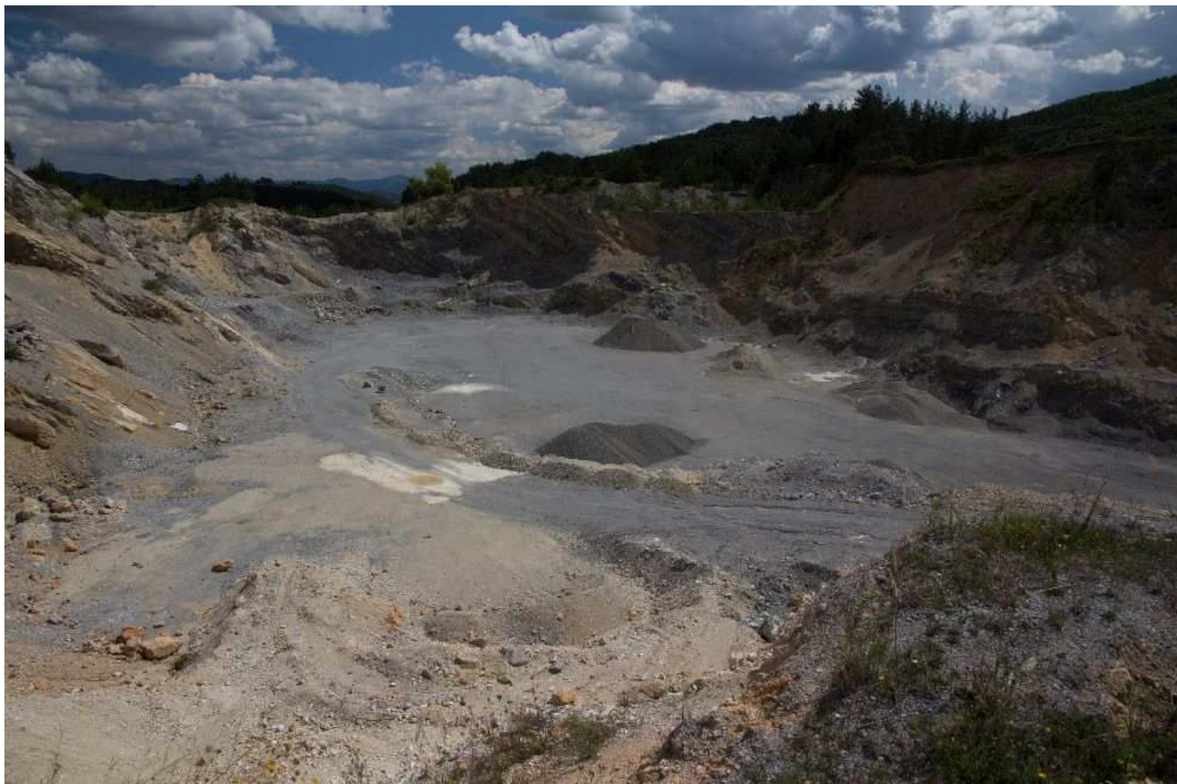
Obr.č.12: Konfliktný bod na trase vedenia v navrhovanom variante VP1 pri Veľkom Poli - ťažobný priestor stavebného kameňa.